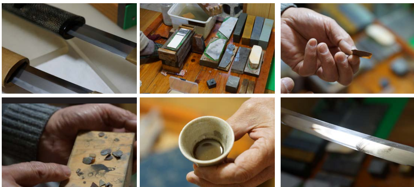
左上から研ぎ終えた刀、砥石色々、紙のように薄く削った砥石、 左下から細かく砕いた砥石、塗装用の油に浸した金属、塗装した刀、向かって右側が青黒い